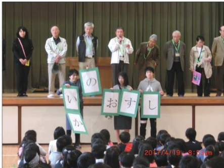
4月19日、見守り隊の代表と東丘小の児童との対面式が行われました。

2015年に新しくスタートした「児童見守り隊」は、緑のタスキ(地域)、ピンクのタスキ(PTA)をかけ外出すると、いつでもどこでも「見守り」ボランティアが出来る東町独特の制度です。「緑のタスキを見ると安心する」との声も多く聞きますが、まだまだ数が足りません。見守り隊員いつでも募集中です。東町の安心・安全をみんなで築いていきましょう。申し込みは東丘小(06-6872-0331)まで