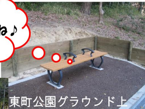
東町公園グラウンド上