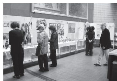
シングル作品展の様子