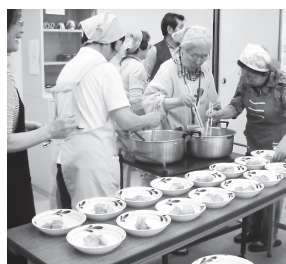
給食サービスの準備