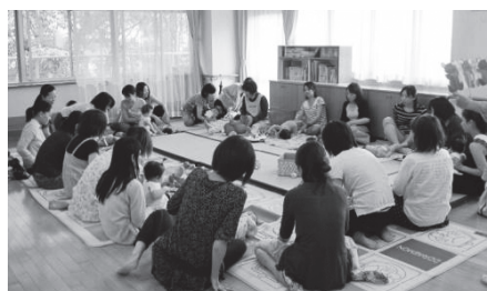
子育てサロンの様子