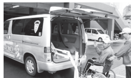
ユウあい号による移送サービス