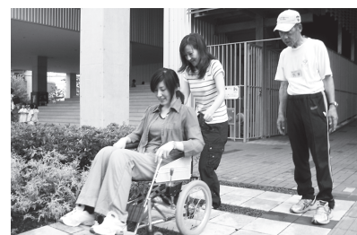
ボランティアスクールのひとこま

身近な地域での助け合いを行うため、『小地域福祉ネットワーク活動』を中心に、次の事業を実施しています。