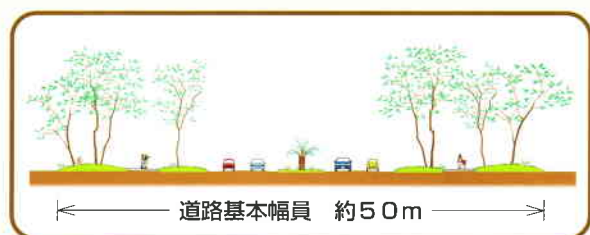
ふどうすいた みのおせん ふくいん りょうわ はばく 府道吹田箕面線の幅員は50mで両側に幅約15m の緑地帯があります。