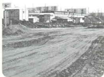
みなみせんりえきまえ 1964 南千里駅前