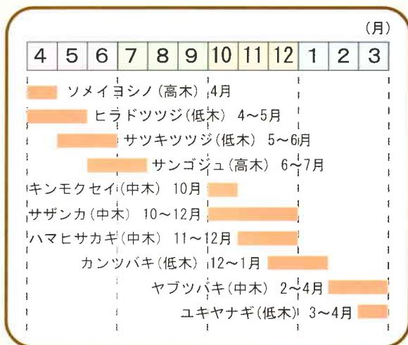
はな 花カレンダー