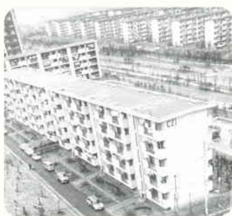
たけみだい 1969 竹見台