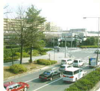
みなみせんりえきまえ 2007 南千里駅前