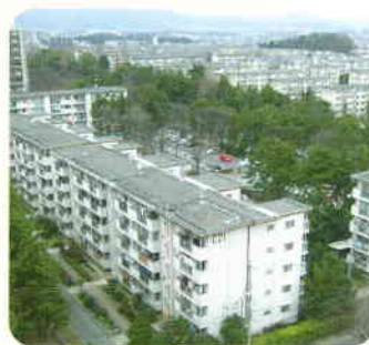
たけみだい 2007 竹見台

千里ニュータウン地域は、平成18(2006)年に全国の緑の街の先進モデルとして『緑の都市賞』を受賞しました。開発から半世紀を経過し、千里ニュータウンに植えられた樹木は、高さ20mをこえるほど大きく育ちました。