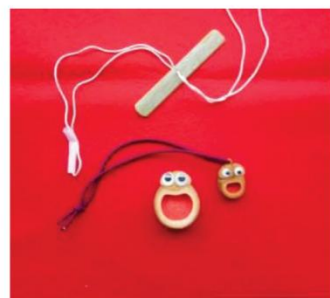
(ブジカエル・ブンブンコマ)