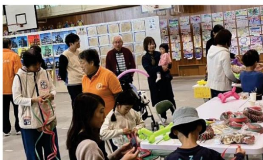
(PPバンドのリースを作るのに1時間、根気が要ります)