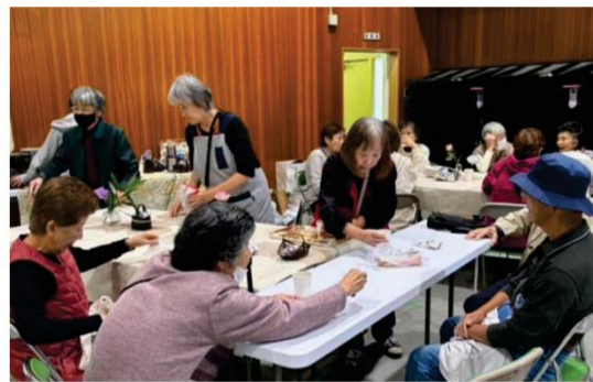
(街デいの喫茶コーナー 楽しくお喋りできました)

一本のバルーンで、かわいい動物やお花があっという間に作れます。初めはおっかなびっくり作っていても、慣れてくると楽しくて、次々作りたくなるようでした。ご来場頂いた大人の方もお手伝いしてください、ありがとうございました。喫茶コーナー・バルーンアート・スマホ相談・ブンブンコマ・ブジカエルのキーホルダー作り・PPバンドのクリスマスリース等どれも大盛況で大人も子どもも楽しめて良かったです。来年も新しい体験に挑戦できるか楽しみです。