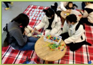
体育館でのクラフト