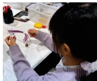
(竹細工のブンブンコマも作ったよ)