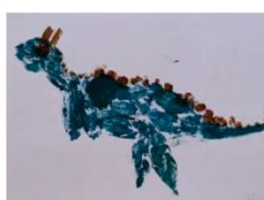
(落ち葉スタンプの恐竜、子どもの感性ってスゴイ!)