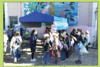
ドキドキのゲーム