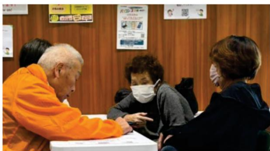
(スマホ相談 何を相談?)