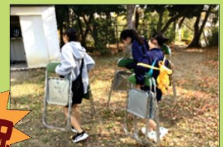
頑張ってます八中生