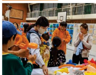
(バルーンで次は何を作ろうかな)