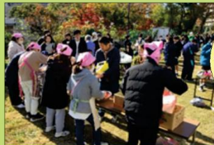
おやじの会を中心に

昨年度から舞台発表と模擬店を隔年で開催することが決まり、今年度は模擬店だけの年。