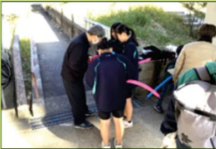
福祉のバルーンアート