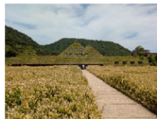
草におおわれた建物

＜ラコリーナ近江八幡＞ 和菓子「たねや」、洋菓子「クラブハリエ」 を展開するたねやグループの旗艦ショップ店で、「自然に学ぶ」を コンセプトとした敷地内ではお菓子や自然を楽しめるようこだわりや 遊び心がちりばめられています。草におおわれた建物や田んぼを鑑賞 したり、バームクーヘンの製造過程を見学したりしました。バームク ーヘンや和菓子をお土産に購入した参加者もありました。