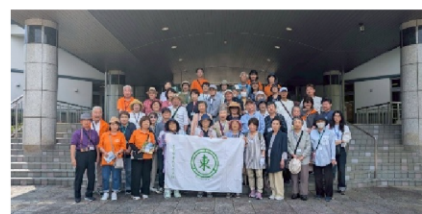
琵琶湖水生植物公園みずの森で記念撮影

＜琵琶湖水生植物公園みずの森＞ 水辺に咲く四季の花々を見ることが できる植物公園では、6月6日からスイレン展が始まったところで、様々 な色のスイレンを鑑賞することができました。園内には、多様な季節の 花々も咲きほこっており、琵琶湖岸ならではの季節感ある風景を楽しむこ うことができました。