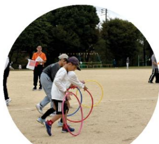
(誰とでもフラフープ 24チームがエントリーしてくれました)