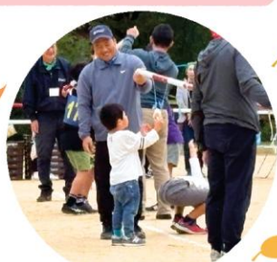
(パン食い競争 可愛いですね!)