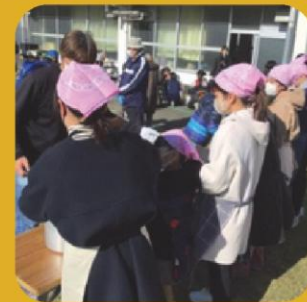
(豚汁や焼きそばの販売をしています)