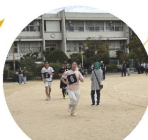
(カントリーレース がんばれー)