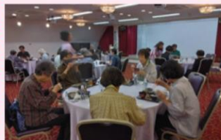
豊泉家のお昼ご飯をいただく