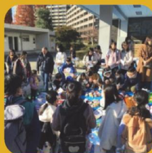
{(体育館前大勢の人で賑やか)}