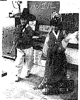
(チマチョゴリ・パジチョゴリ)