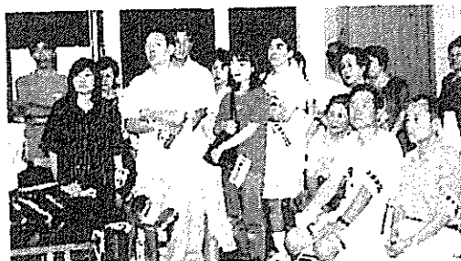
巡視前の防犯委員の皆さん