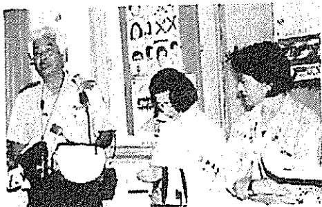
巡視に於ける注意事項を受けているところ

豊中市が「歩いて暮らせる街づくり」の一定条件を備えていることから、千里ニュータウンに於ける「安全で快適な街づくり」のテストケースとして、警察庁から支援を受けて東丘地区に8箇所の歩行者支援信号システムが試験的に設置