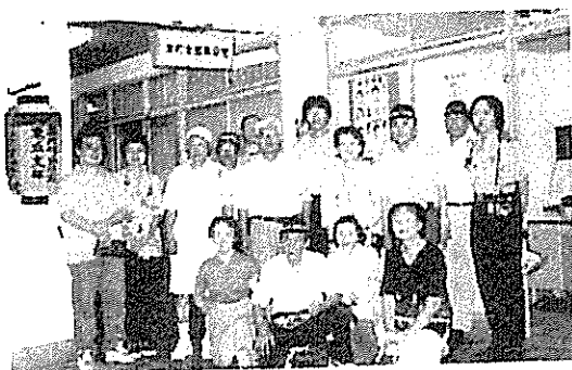
合同パトロールに参加の皆さん